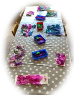
Kreativ sein im Atelier