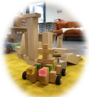
Die „Welt des Bauens und der Technik“ in der WELTentdeckerwerkstatt erkunden.