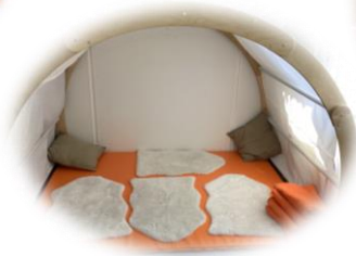
ausruhen und Rückzug im Traumzimmer