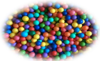
bewegen in der Bewegungswerkstatt