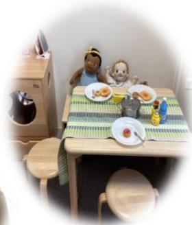
alltagsnahes Spiel im Kinderdorf